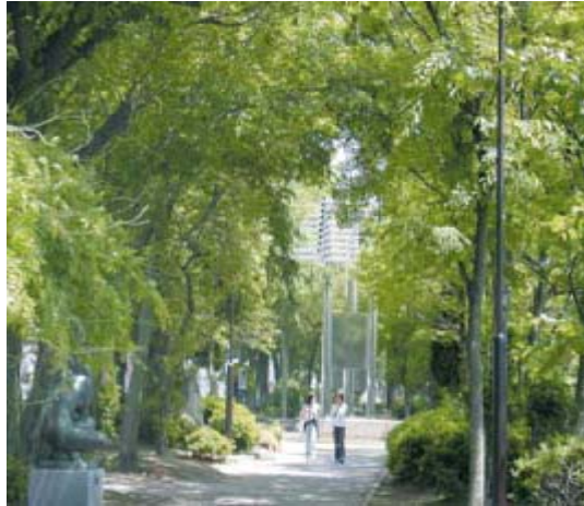
(宇部市景観計画概要版 2007 より)