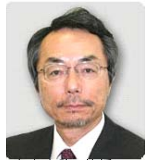
青山吉隆 教授